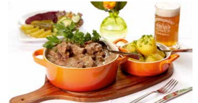
WESTFÄLISCHER PFEFFERPOTTHAST Dieses Rezept finden Sie auf der Seite 117

Trotz aller Traditionen hat der Familienbetrieb in den letzten Jahren einen spannenden Wandel vollzogen. Mit Erfolg. Denn er spricht heute sowohl jene alteingesessenen Bielefelder an, die das Haus seit Kindestagen kennen und lieben, als auch neue und hinzugezogene Gäste, die gerne in ihr frisch entdecktes Wohnzimmer mit Steuerrad, Dreimaster und Schiffsglocke wiederkommen.